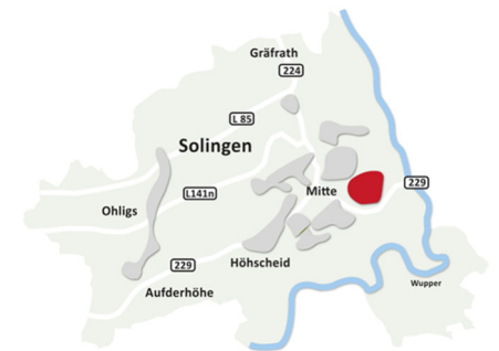
In Solingen-Mitte | Meigen: Siedlung Hacketäuerstraße