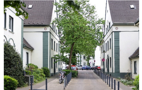
Stilvoller Altbau in der Siedlung Cäcilienstraße