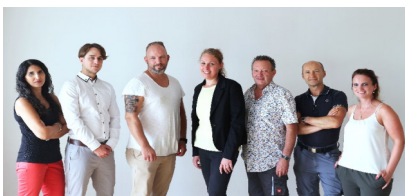
Ihr Team 2

Spar- und Bauverein Solingen eG · Gemeinnützige Wohnungsgenossenschaft Kölner Straße 47 · 42651 Solingen · Tel.: 02 12 / 20 66 - 820 Team-Wohnen2@sbv-solingen.de · www.sbv-solingen.de