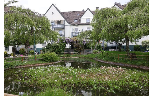
Grüne Oase in Innenstadtnähe

Wir beraten Sie gerne persönlich zu allen Wohnungsangeboten, Fragen, auch zur WBS-Berechtigung und allen Service-Vorteilen für ein rundum gutes Wohngefühl.