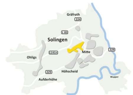
In Solingen-Mitte: Siedlung Cäcilienstraße