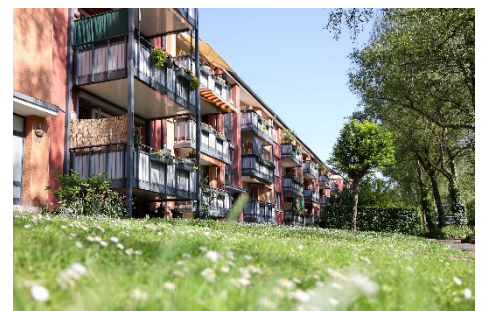
Einladend: Hauseingang nach Modernisierung