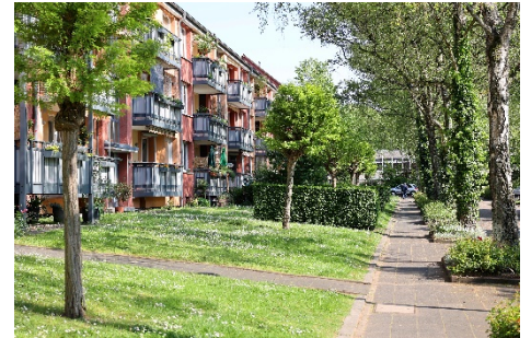
Wohnen wie im Park mit ansprechender Optik