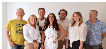
Ihr Team 1

Spar- und Bauverein Solingen eG • Gemeinnützige Wohnungsgenossenschaft Kölner Straße 47 • 42651 Solingen • Tel.: 02 12 / 20 66 - 810 Team-Wohnen1@sbv-solingen.de + www.sbv-solingen.de