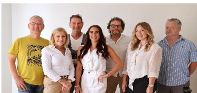
Ihr Team 1

Spar- und Bauverein Solingen eG • Gemeinnützige Wohnungsgenossenschaft Kölner Straße 47 • 42651 Solingen • Tel.: 02 12 / 20 66 - 810 Team-Wohnen1@sbv-solingen.de + www.sbv-solingen.de