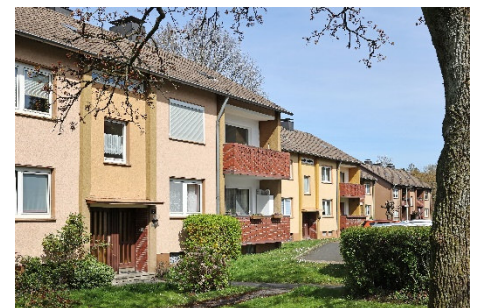
Eingang zum ruhigen und preiswerten Zuhause