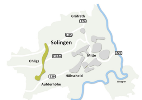
In Solingen-Ohligs: Siedlung Bavert