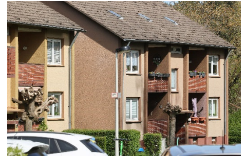
Grüne Siedlung Bavert